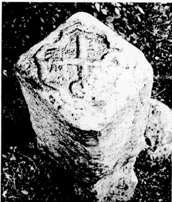
Borne de limite Musée du Terroir, Villeneuve d'Ascq

(Flandre, Artois, Hainaut, Cambrai, Boulogne)